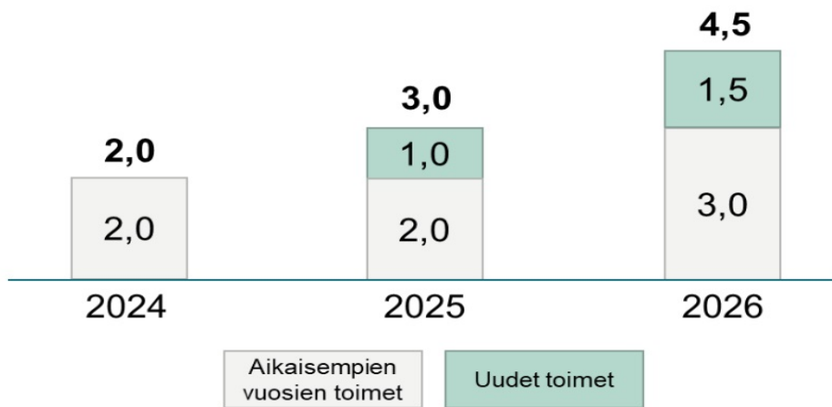
Kuvio 1. Sopeutustoimien vuosittainen kokonaisvaikutus (oletus, että aiempien vuosien toimet jäävät pysyviksi)

Tämän välilehden tarkoituksena on ilmoittaa alueen muutosohjelman kokonaisvaikutus. Toimenpiteet-välilehden tiedot eivät korvaa tämän välilehden tietoja, mutta ilmoita alla olevaan taulukkoon tavoiteltava vuosittainen kokonaisvaikutus. Vuosittaiseen kokonaisvaikutukseen tulee sisältyä aikaisempien vuosien toimenpiteiden vaikutus. Taulukko laskee automaattisesti vuoden 2026 loppuun kertyneen kumulatiivisen kokonaisvaikutuksen. Voit näin tarkastaa vastaako kumulatiivinen kokonaisvaikutus esimerkiksi aikaisempien vuosien toimenpiteiden vaikutusta. Ilmoita lisäksi omaan kenttäänsä raportointihetken ennuste kustannusvaikutuksesta. Ilmoita lisäksi, kuinka paljon kustannusvaikutuksesta on huomioitu kyseiset toimenpiteet.