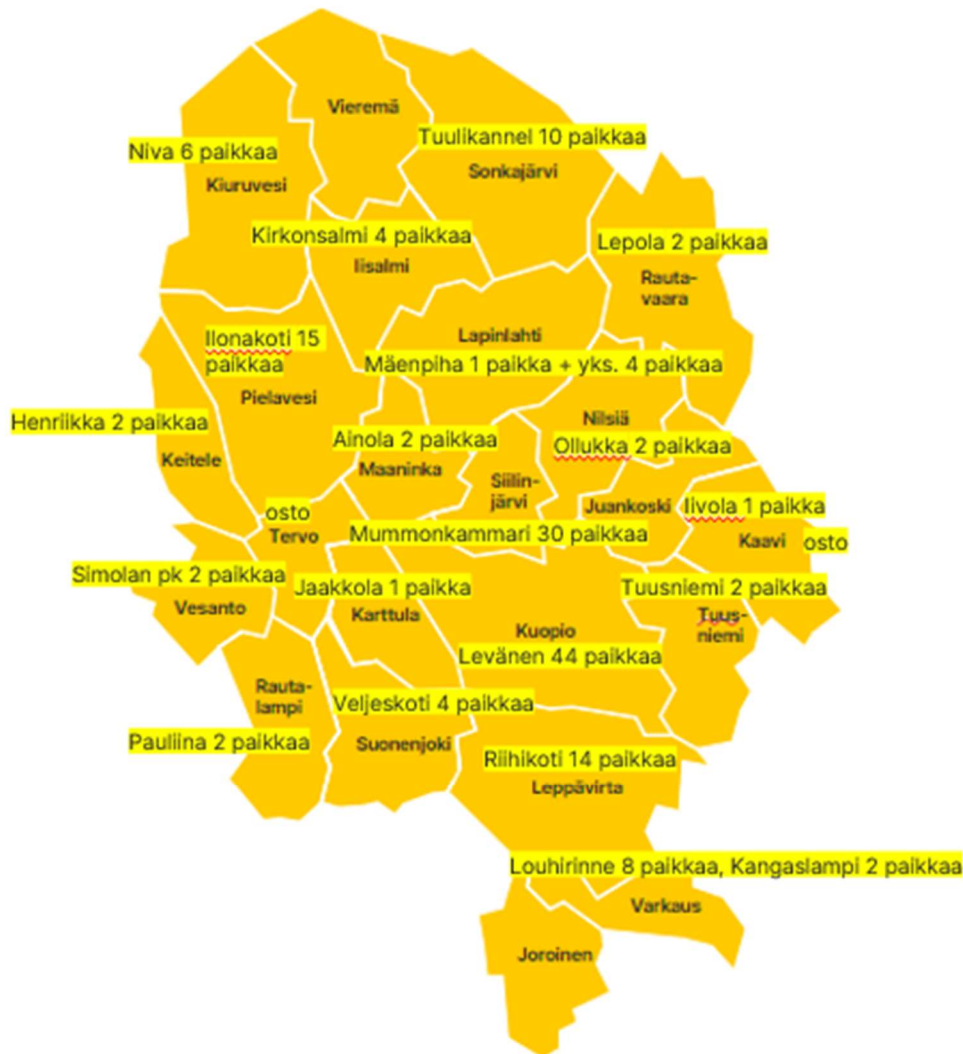
Kuva 4. Tilapäisen asumisen paikat kartalla oman tuotannon osalta