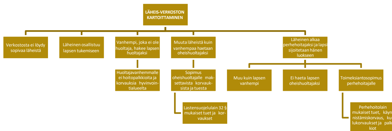
Kuva 1 Lapsen lähiverkoston kartoittaminen ennen lapsen sijoitusta kodin ulkopuolelle Kaavio on mukailtu Kati Saastamoisen luentoaineistosta

Mikäli perhehoitoa tarvitsevalle lapselle löytyy lähiverkostosta sijaisperheeksi mahdollinen soveltuva perhe , heidät tavataan ja annetaan tietoa perhehoidosta, mitä se käytännössä tarkoittaa, suljetaan pois ehdottomat esteet ja arvioidaan, mikä eri vaihtoehdoista on lapsen edun mukaisin ratkaisu. Mikäli lähiverkostoperheellä ei ole ennestään valmennusta, järjestetään ryhmämuotoinen tai perhekohtainen valmennus .