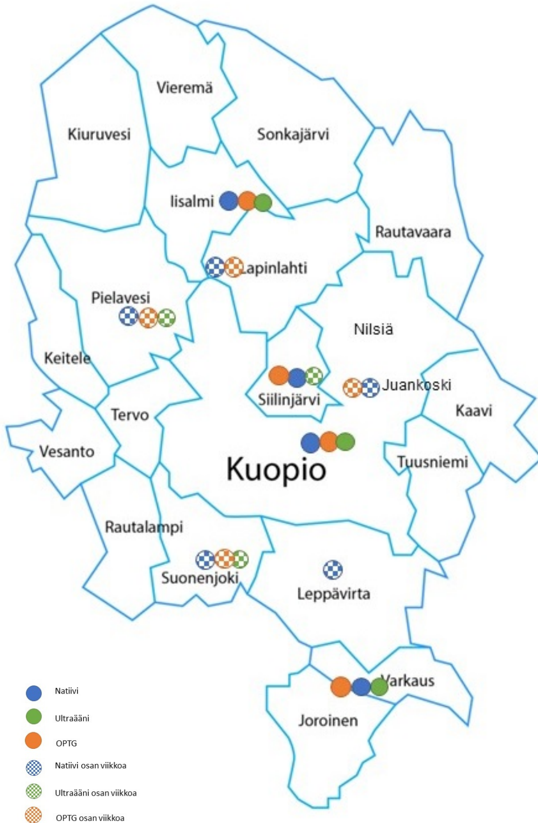
Kuvaaja 3. Esitetty radiologisen kuvantamisen palvelurakenne perusterveydenhuollossa ja lähisairaaloissa.