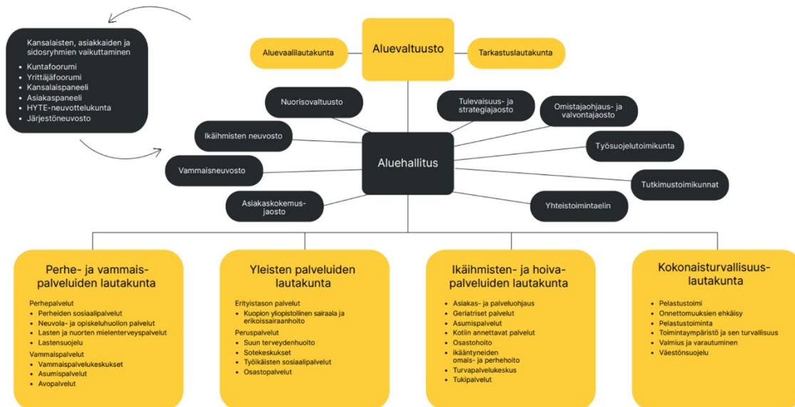
Kuva 1: Asukaspaneeli osana organisaatiota